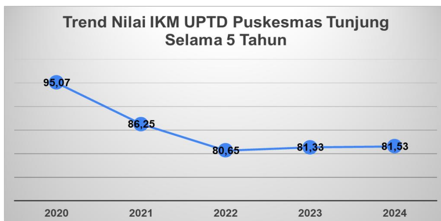
Grafik 3. Tren Nilai SKM Tahun 2020-2024

Berdasarkan tabel di atas, dapat disimpulkan bahwa terjadi penurunan IKM sejak tahun 2020-2022 dan naik secara perlahan kinerja penyelenggaraan pelayanan publik dari tahun 2020 hingga 2024 pada UPTD. Puskesmas Tunjung Kabupaten Lumajang.